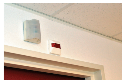
● Alerte via le système d'appel ou ...