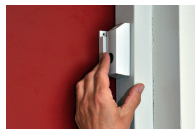
● Mise en fonction par un clic sur le bouton

Evidemment, le contact de porte communique avec tous nos récepteurs.